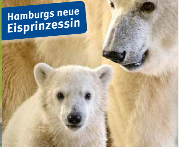
Hamburgs neue Eisprinzessin