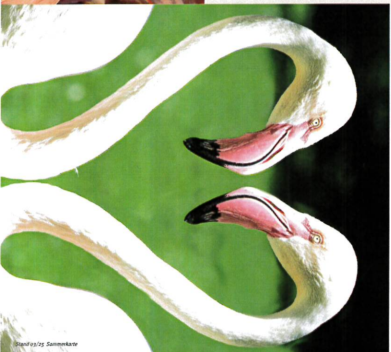
Stand 03/25 Sommerkarte

Gastronomie Carl Hagenbeck GmbH Tel. (040) 53 00 33 - 318 gastronomie@hagenbeck.de